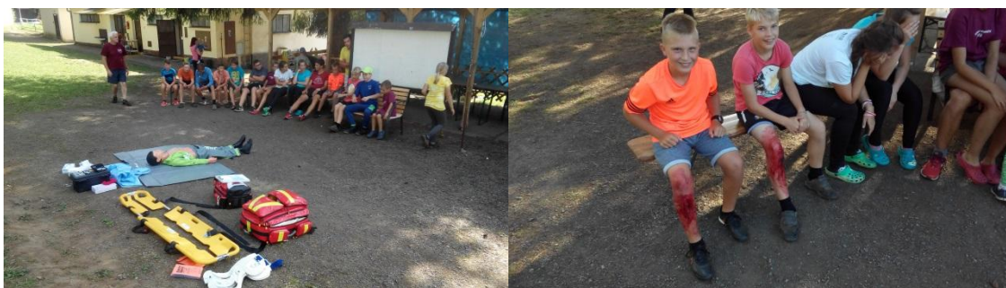
Letní soustředění mladých hasičů s praktickou ukázkou poskytování první pomoci