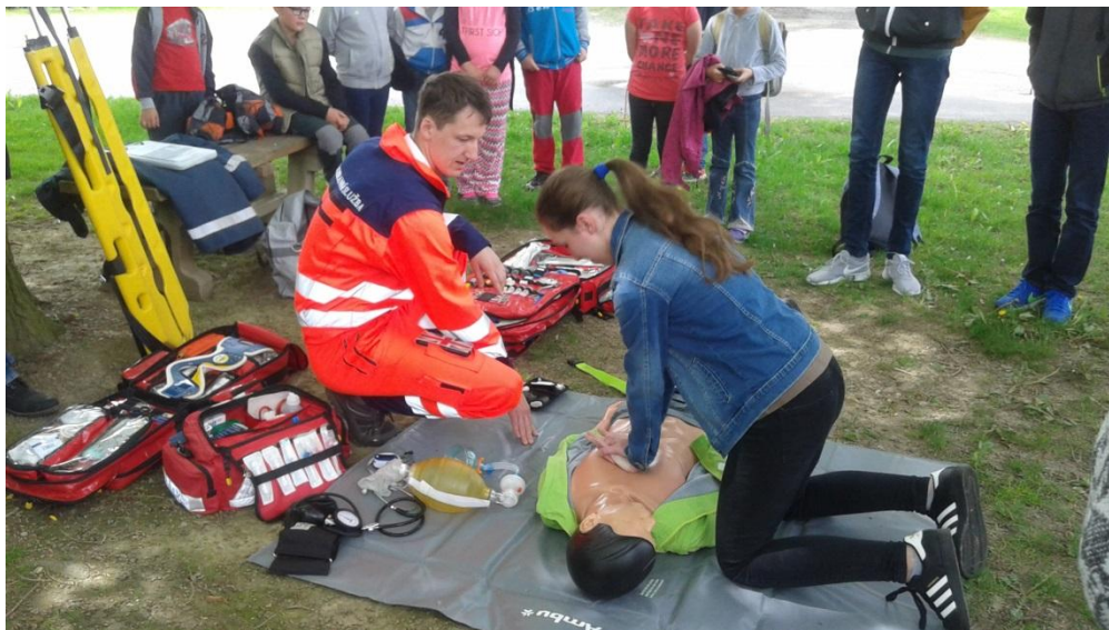
Praktická ukázka výcviku s „AMBU MANEM“